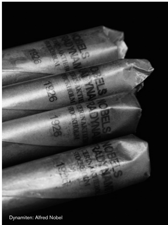
Dynamiten: Alfred Nobel