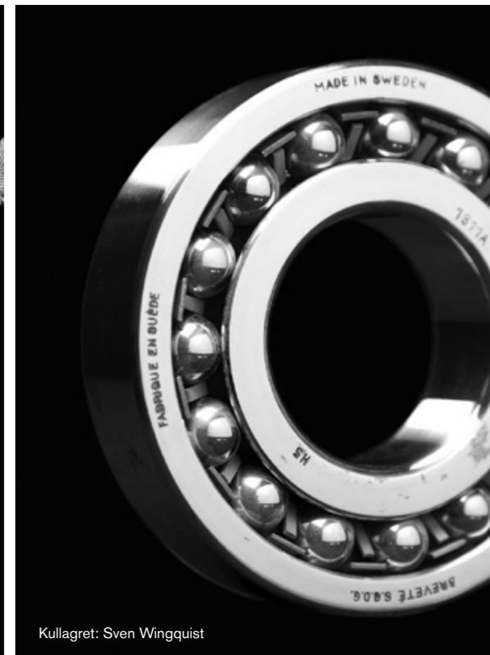
Kullagret: Sven Wingquist

Immateriella rättigheter är ett gemensamt uttryck för rättigheter till patent, varumärke, mönsterskydd/design och copyright/upphovsrätt.